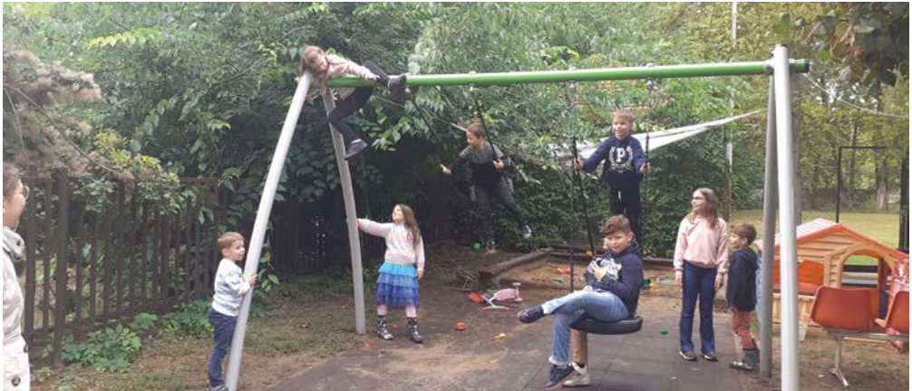
Gyermekek piknikeznek templomunk udvarán