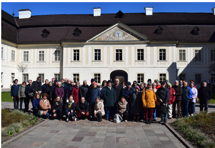
Kirándulók a szentantali kastélyban